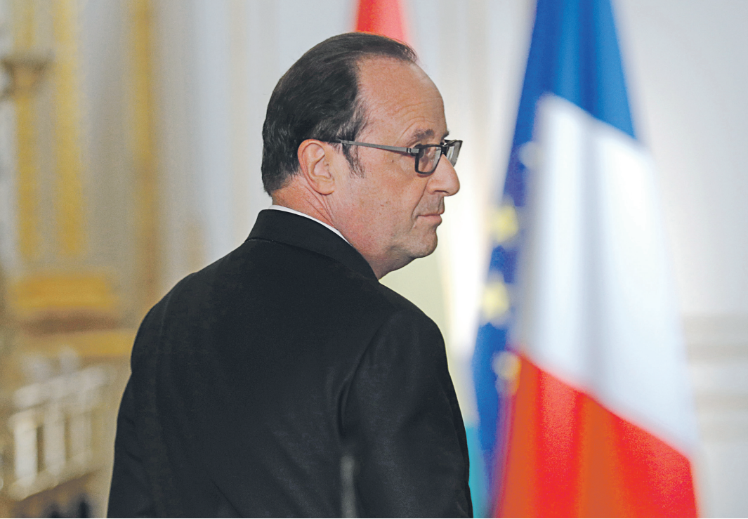
Dosluhujúci Francois Hollande za svoje pôsobenie na čele krajiny zožal väčšinou len kritiku.

Náročné to majú v krajine aj zamestnávateľia, ktorých príjmy podliehajú komplikovanému systému progresívneho zdaňovania, ktorý